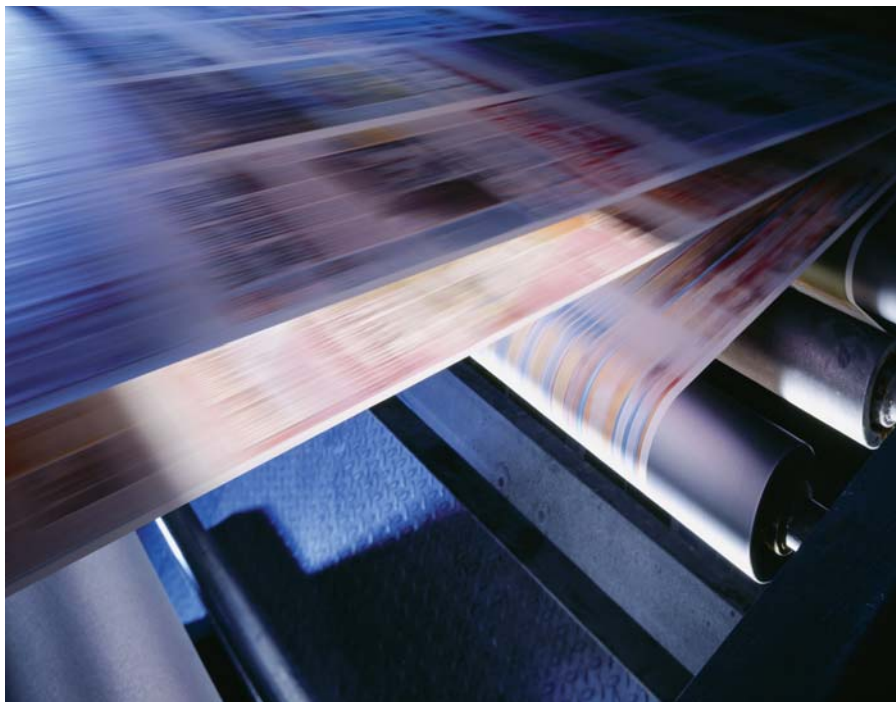
Системы транспортировки бумаги, как в этой типографии, – это всего лишь одна из многих областей применения новых преобразователей частоты серии FR-E700.