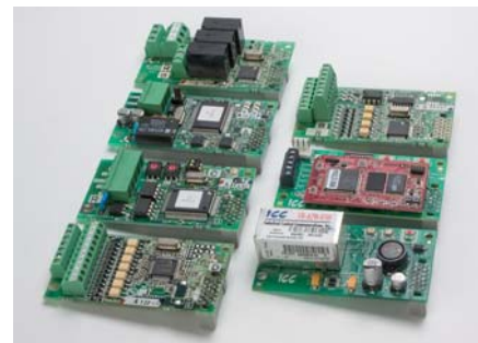
Опциональные платы для дополнительных функций.

Функциональность может быть расширена путем использования опциональ-